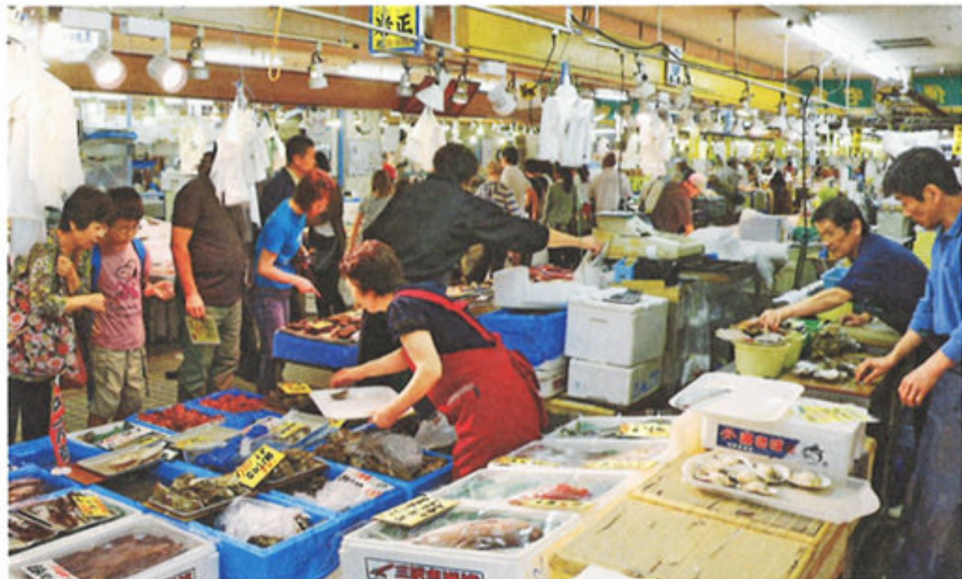
とれたての鮮魚が並ぶ港町の名物市場・八食センター