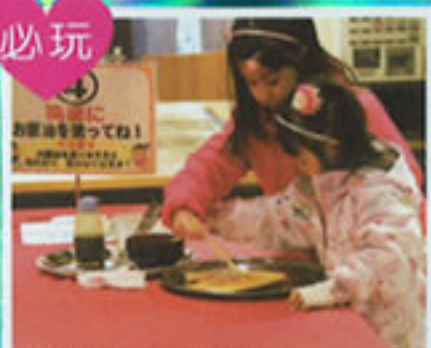
自製獨一無二燒餅 新潟せんべえ王国