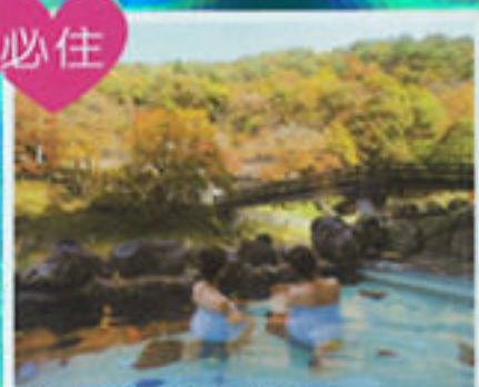
絕境怡人溫泉酒店 大沢溫泉 山水閣