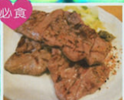
仙台第一名物 炭燒牛舌